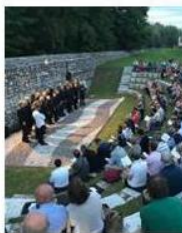
Un momento del concerto

con il consorzio di bonifica Brenta , ieri sera a San Lazzaro si è rinnovato l'appuntamento con il tradizionale evento musicale d'inizio estate. Una serata che, come sempre, ha richiamato nel sito di "manovra" e controllo del fiume e delle rogge bassanesi, centinaia di persone, allettate sia dall'ottimo repertorio di canti popolari proposti dai trenta coristi della formazione cittadina sia dalla possibilità di visitare, prima dell'inizio del concerto, l'area verde