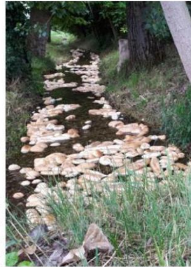
I panini, le pagnotte e i filoni gettati nella roggia Cassandra. BILLO

voro», racconta il primo cittadino. «Passando per la zona di Levà ha deciso di fermarsi lungo un fosso e di scaricarvi dentro decine di pagnotte, panini e filoncini. Mi ha assicurato che non lo fa mai, era la prima: di solito regala ciò che avanza dalla giornata lavorativa ad alcuni allevatori che lo utilizzano come alimento per il bestiame (oppure in beneficenza). Non pensava che la sua azione potesse inquinare il corso d'acqua». Nonostante le spiegazioni, ora per il fornaio scatterà una sanzione. «Gli ho spiegato che cose del genere non si fanno sia per quanto riguarda l'aspetto ambientale - all'interno della roggia abbiamo trovato anche sacchetti di nylon - ma soprattutto per una questione di spreco di cibo: il pane è uno dei pochi alimenti che si può riutilizzare per sfamare i