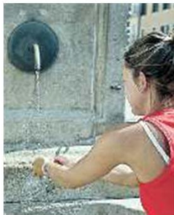
APPROVVIGIONAMENTO La falda di Este non è la stessa dell'area rossa