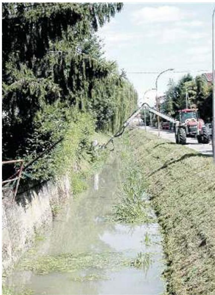
LA PULIZIA Un intervento sul canale Fossa Storta