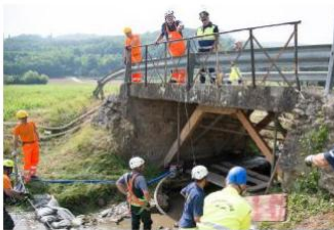
Una recente esercitazione della protezione civile ad Arcugnano